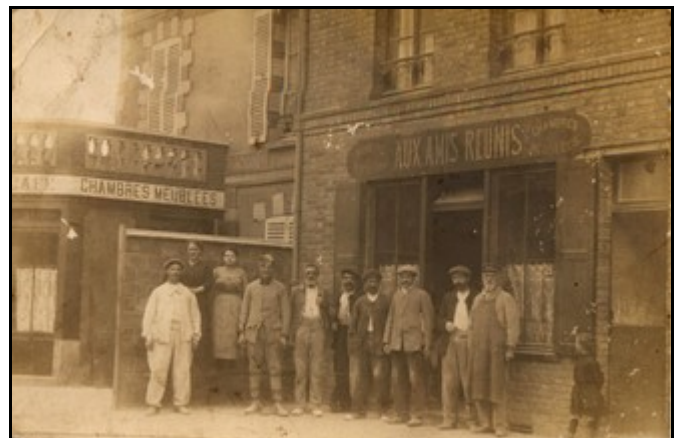
Le café Fromentin en 1913 avec sa première devanture "Aux Amis Réunis. Buvette. Restaurant. Chambres meublées". Au côté gauche, le café Bridon qui propose également des chambres meublées. Cette salle de café qui fait saillie sur la rue a été démolie pendant la dernière guerre.