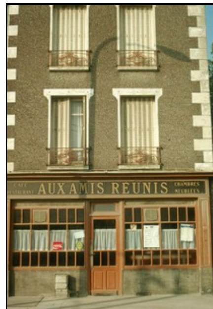
Les Amis Réunis en 1994 avant la démolition du quartier.

De plus, le contact établi avec les autorités départementales, peut contribuer à une réflexion locale sur la pérennisation des musées de Cormeilles et l'élargissement de leur audience. La présentation des "Amis Réunis", éléments de la mémoire de Cormeilles-en-Parisis, concerne également le monde plâtrier dans son ensemble comme exemple de la vie sociale générée autour des plâtrières de la Région parisienne. On ne peut que souligner que l'activité plâtrière a fait la richesse de Cormeilles et forgé une part de son identité.