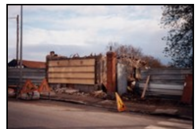
Le café Fromentin démolit, avril 1998.