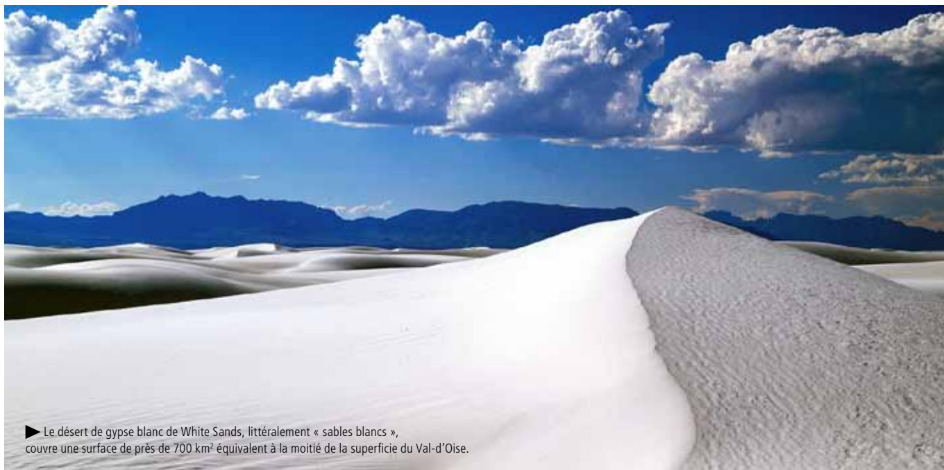
► Le désert de gypse blanc de White Sands, littéralement « sables blancs », couvre une surface de près de 700 km 2 équivalent à la moitié de la superficie du Val-d'Oise.

Composé exclusivement de gypse blanc, le désert américain de White Sands est un phénomène unique au monde.