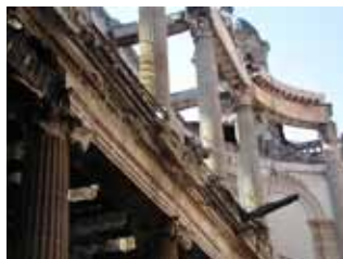
► Chapelle du château de Lunéville (Meurthe-et-Moselle) et ses décors en gypserie après restauration en 2010 et après l'incendie de 2003.