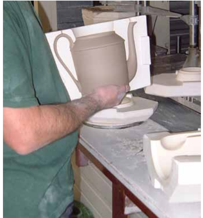
► Avant cuisson, démoulage d'une cafetière en porcelaine. (Porcelaines de La Fabrique / Limoges).

Le plâtre n'intervient jamais dans la composition de la pâte céramique, mais sert à la fabrication des moules pour la production des pièces. Les plâtres de moulage sont donc parfaitement adaptés.